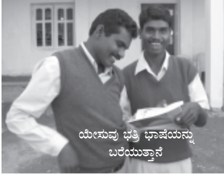
ಯೇಸುವು ಭತ್ತಿ ಭಾಷೆಯನ್ನು ಬರೆಯುತ್ತಾನೆ