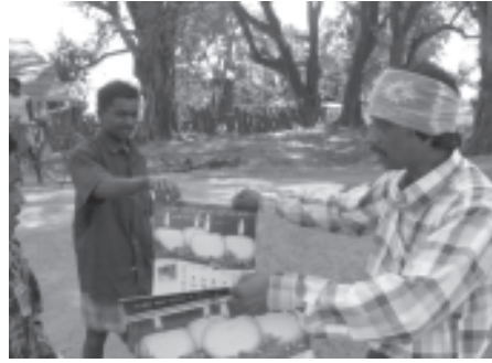
ಭತ್ತಿ ಭಾಷೆಯ ಒಂದು ಕ್ಯಾಲೆಂಡರ್ ತೆಗೆದುಕೊಳ್ಳುತ್ತಿರುವುದು