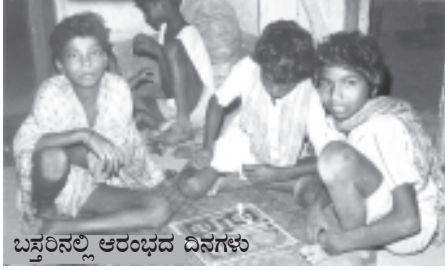
ಬಸ್ತರಿನಲ್ಲಿ ಆರಂಭದ ದಿನಗಳು