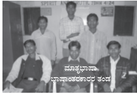
ಮಾತೃಭಾಷಾ ಭಾಷಾಂತರಕಾರರ ತಂಡ