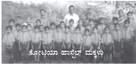
ಕೋಟಿಯಾ ಹಾಸ್ಟೆಲ್ ಮಕ್ಕಳು

ಸದ್ಯದಲ್ಲಿ ಐ.ಇ.ಎಂ. 18 ಹಾಸ್ಟೆಲ್ಲುಗಳನ್ನು ಅತಿ ಬಡಮಕ್ಕಳಿಗಾಗಿ ನಡೆಸಲಾಗುತ್ತಿದೆ. ಹೆಚ್ಚಿನವುಗಳನ್ನು ಬಾಡಿಗೆ ಮನೆಗಳಲ್ಲಿ ನಡೆಸಲಾಗುತ್ತಿದೆ. ದೇವರ ಚಿತ್ತವಿದ್ದಲ್ಲಿ ಚೆಂಚು (ಆ.ಪ್ರ.) ಗರಾಸಿಯಾ (ಗುಜರಾತು) ಥಾರು (ಉ.ಪ್ರ.) ಖೋಂಡ್ (ಒಡಿಶ)