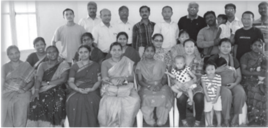
ಐ.ಇ.ಎಂ.ನ ಸತ್ಯವೇದ ಭಾಷಾಂತರಕಾರರು